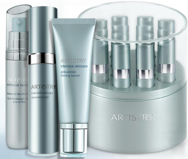
Abbildung 1 Tri-Optic-Partikelsystem, das die Mängel der Hautober- fläche verschwinden lässt